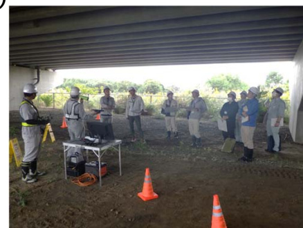
【昨年度の橋梁点検勉強会の様子】