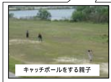
キャッチボールをする親子