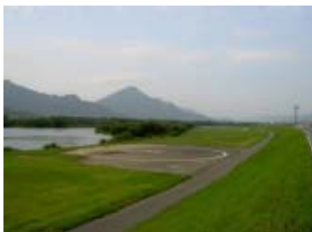
災害時用のヘリポート(4.8k付近)