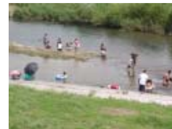
水辺を楽しむ子供たち