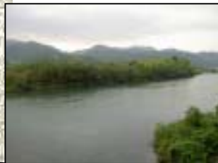
中央橋からの風景