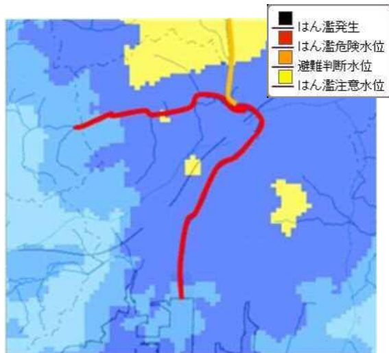
「川の防災情報」の表示例