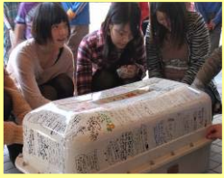
カプセルに書いたメッセージを読む卒業生。中のお宝との対面まであと少し♪♪

10年も地下に潜伏し、いろんな秘密を守り抜いたカプセルくんは脱帽ぢや！ いやあ、実に口が固いのオ☆ おしまい☆