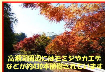
高瀬湖周辺にはミジヤカエテなどが約430本植樹されています