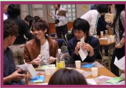
えーお前なに書いたん？ こっそり見たろー (これはイメージです)